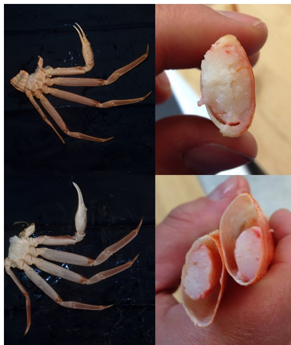
Øverst: Snøkrabbe med høy fyllingsgrad Nederst: Snøkrabbe med lavere fyllingsgrad

Kvalitet måles etter to kriterier: Innhold av kjøtt i bein (kjøttfylde/fyllingsgrad) og antall intakte bein. Slaktede krabbecluster deles inn i tre forskjellige klasser: Superior, N og P. Et cluster med superior-kvalitet har minst de fire største beina intakt og en fyllingsgrad på over 80%. Et