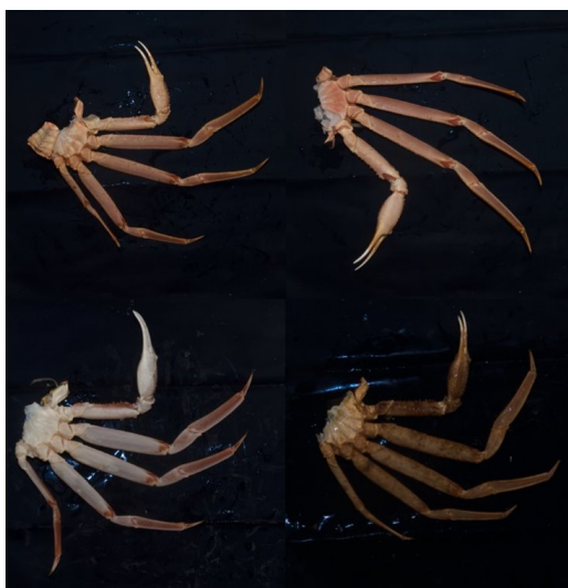
Bilder av snøkrabbecluster rett etter slakting

Snøkrabbefisket i Barentshavet gjennomføres i dag hovedsakelig med om bord prosessering. Sorteringen av prosessert snøkrabbe skjer etter slakting. Under slakting deles krabben i to cluster: venstre og høyre. Hvert cluster sorteres etter vekt og kvalitet. Vektsortering er i dag utført automatisk med en vektcelle koblet til et transportbånd hvor utslagsklaffer sender hvert cluster til sin tilhørende vektklasse.