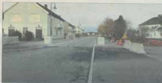
STEINSATT: Den nye Nordgata i Verdal sentrum har samme stil som resten av de opprusede sentrumsgatene, mye stein.

– Vi er en liten butikk med to millioner i omsetning. Når det er enkeltmåneder man taper 50.000 i omsetning er det mye for meg. Enkelte dager har det ikke vært kunder innom, sier hun. Musum kritiserer kommunen for dårlig informasjon underveis.