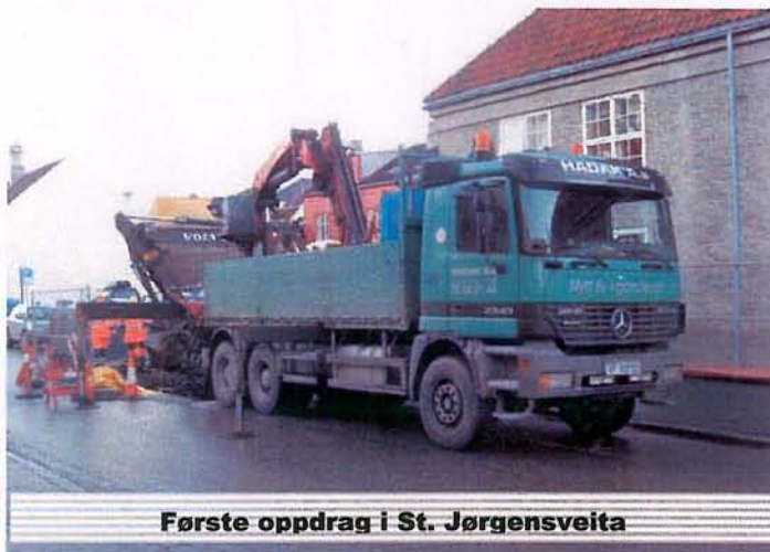
Første oppdrag i St. Jørgensveita