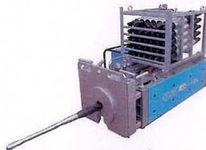
GRUNDOBURST 800 G

Vi har nå anskaffet en GRUNDOBURST 800 G som med en kraft på opp til 80 tonn splitter og blokker ut det gamle røret, og trekker inn den nye ledningen i en operasjon. Metoden kan brukes på alle typer ledninger, også duktilt støpejern, og på dimensjoner opp til ø400 mm.