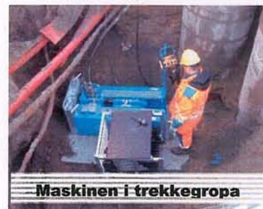
Maskinen i trekkegropa

Vi utfører i vinter et større oppdrag med utblokkning for Trondheim kommune!