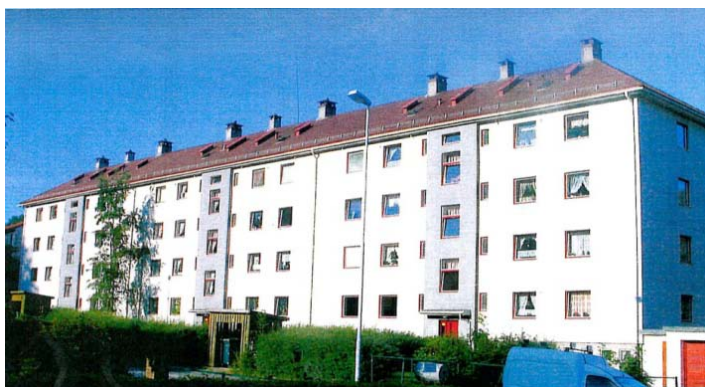
Adolph Bergs vei 45-49

Prosjektet var kalkulert til en samlet kostnad på 3,9 mill. Det var gjennomført totalentreprisekonkurranse med forhandling i markedet, i henhold til Lov om offentlige anskaffelser. Prosjektet var gjennomgått av Husbanken, og det var gitt tilsagn om boligtilskudd på 2,6 mill. resten av kostnadene ble finansiert ved midler fra planlagt vedlikehold. Husleien økte ikke for beboerne. Kommunen har prinsipp om gjengse leie.