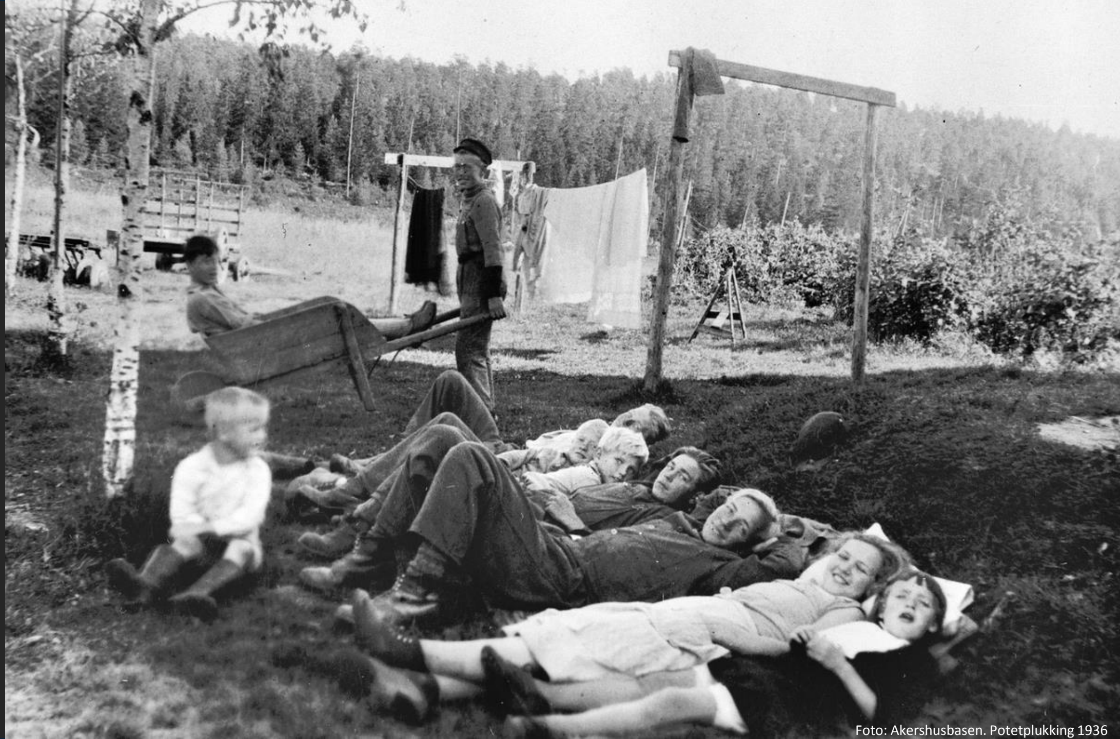
Potetplukking 1936