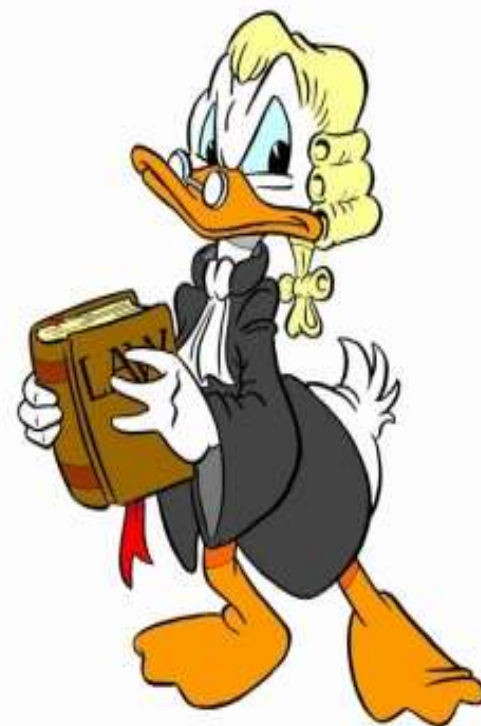
Mr. Duck, Advocaat