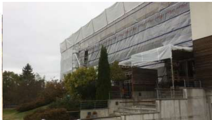
Foto 5. Vekst av sopp på OSB-plate og ned på lekt monterert på toppen av bjelke i etasjeskiller under balkong mot kjøkken.