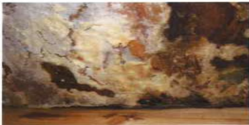
Foto 4. Soppvekst på undersiden av OSB-plater i etasjeskiller sett fra kjøkken opp mot underside balkong.

Det er benyttet vindtettingsprodukter med for stor dampmotstand, slik at fukt har blitt stående i konstruksjonen uten mulighet for å kunne ventileres ut. I tillegg har fritt vann blitt stående i det nedsenkende partiet og trukket gjennom vindsperre og videre inn til konstruksjonen.