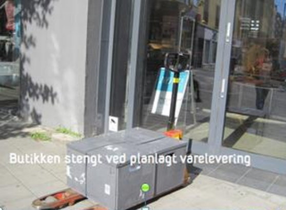
Butikken stengt ved planlagt varelevering