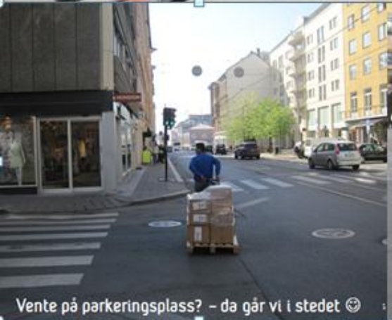
Vente på parkeringsplass? - da går vi i stedet 😊