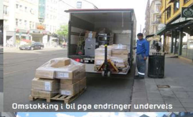
Omstokking i bil pga endringer underveis