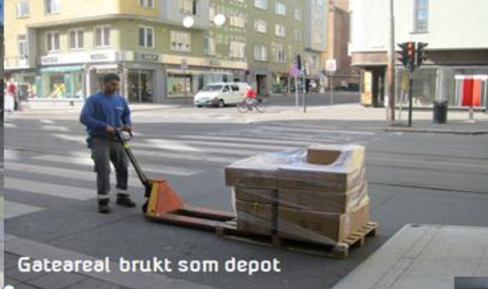
Gateareal brukt som depot