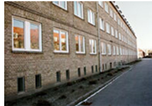
Før rehabilitering, mot gården