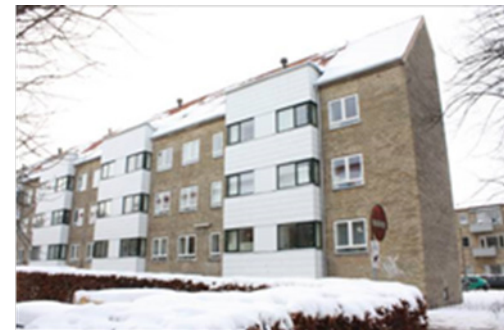
Etter rehabilitering, mot gården