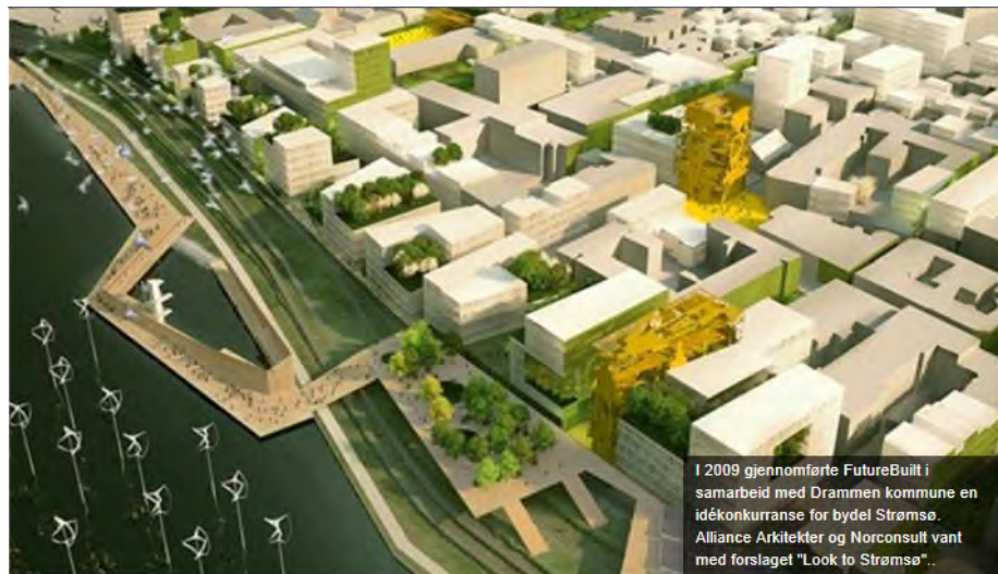
Arkitekturkonkurranser i FutureBuilt