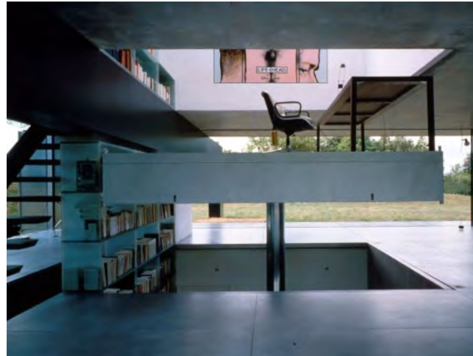
Enebolig for rullestolbruker i Bordeaux Arkitekt: Oma