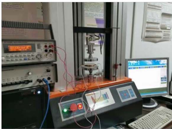
Dispozitiv implementat in UPT pentru determinarea rezistentei de contact interfacial