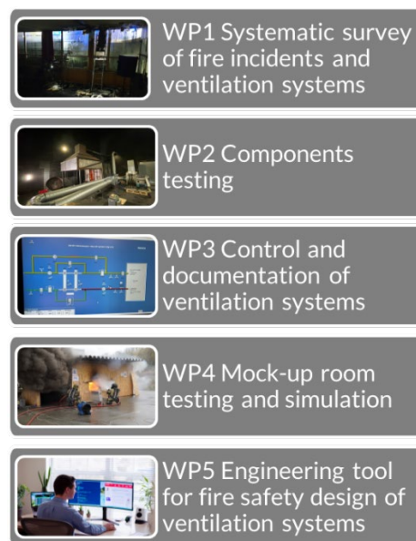
Fig. 1 Oversikt over arbeidspakkene.

Dette er det første nyhetsbrevet som blir publisert i prosjektet. Fremover vil nyhetsbrevene publiseres kvartalsvis.