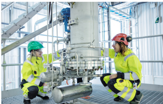
Gassifiseringsreaktoren i forbrenningslaboratoriet i SINTEF Energy Lab.

Det nasjonale SmartGrid laboratoriet benyttes til forskning på løsninger og teknologier for fremtidas bærekraftige elkraftsystem med mer variabel og distribuert kraftproduksjon, fleksibelt forbruk og digitaliserte løsninger.