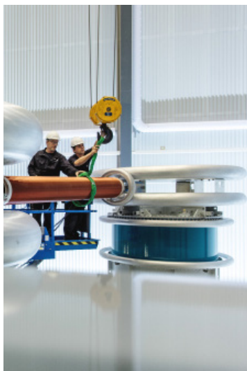
Rigging av forsøk i de elektrotekniske laboratoriene.