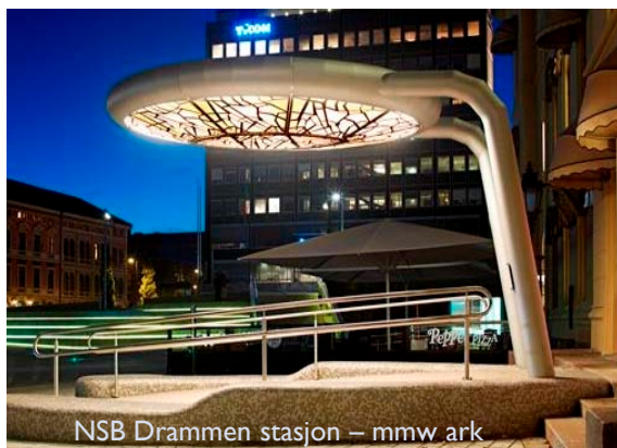
NSB Drammen stasjon – mmw ark