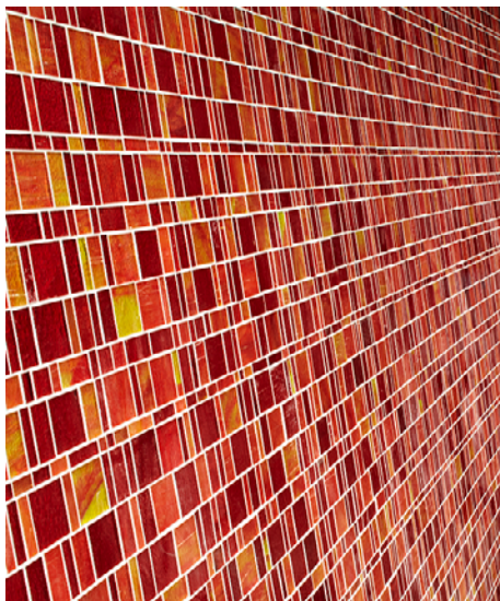
Detalj fra Marienlyst skole – HWR Ark.

Anvendelsen av keramiske fliser har økt betraktelig i Norge de senere årene, både som belegg på golv og vegger i våte og tørre rom og som utvendig kledning. Nye materialer og løsninger har kommet til. Det har derfor oppstått et klart behov for økt kunnskap om materialene, konstruksjonsløsninger og leggeteknikk. Byggkeramikforeningen (BKF) og SINTEF Byggforsk har gått sammen om å lage boka Alt om Flislegging , som behandler temaet inngående. Boka tar sikte på å fungere som et oppslagsverk for arkitekter, rådgivere, entreprenører, håndverkere og selvbyggere. I seminaret vil vi presentere noe av innholdet i boka kombinert med praktisk veiledning og prosjektpresentasjoner. Seminaret arrangeres i regi av Byggkeramikforeningen.