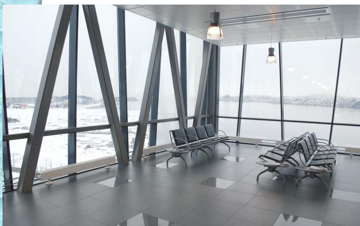
Utenriksterminalen Risavika – Arkipartner AS

Kursavgift kr 550,- inkl. boka Alt om Flislegging