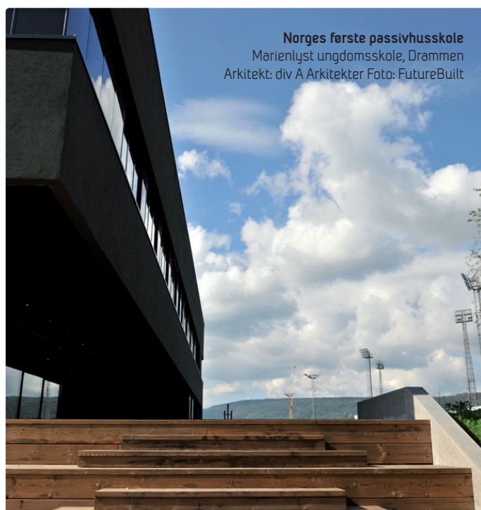
Norges første passivhusskole Marienlyst ungdomsskole, Drammen Arkitekt: div A Arkitekter

Passivhusdebatten i Norden er imidlertid preget av et stort behov for forskningsbasert kunnskap, og denne konferansen har som mål å skille myter fra fakta.