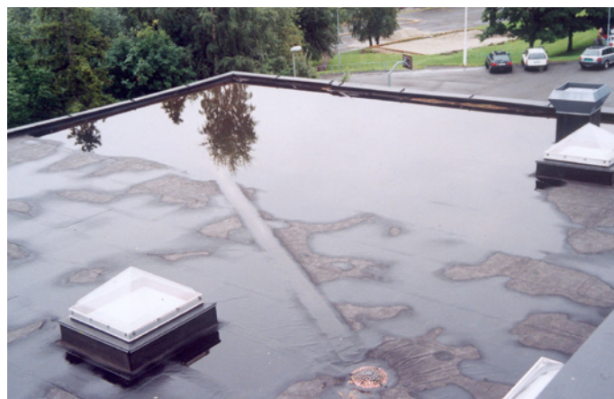
Fig. 1. Uønsket stående vann på taket.