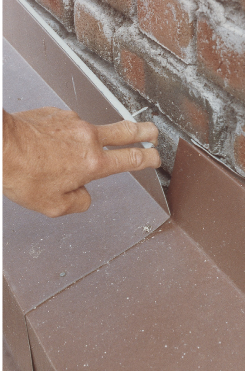
Fig. 4. Utett innføringsfuge i teglvegg.