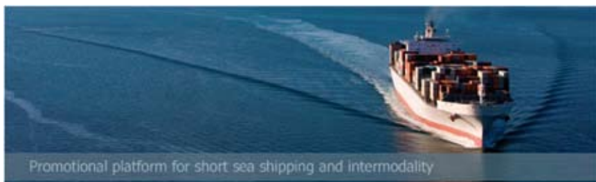
Promotional platform for short sea shipping and intermodality

MARINTEK Maritime Logistics er en avdeling innen MARINTEK som driver forskning, innovasjon og rådgiving innen intermodal transport og logistikk der hvor sjøtransport er en viktig del av løsningen. Fagmiljøet er spesialisert innen områder som komparative logistikkanalyser og benchmarking