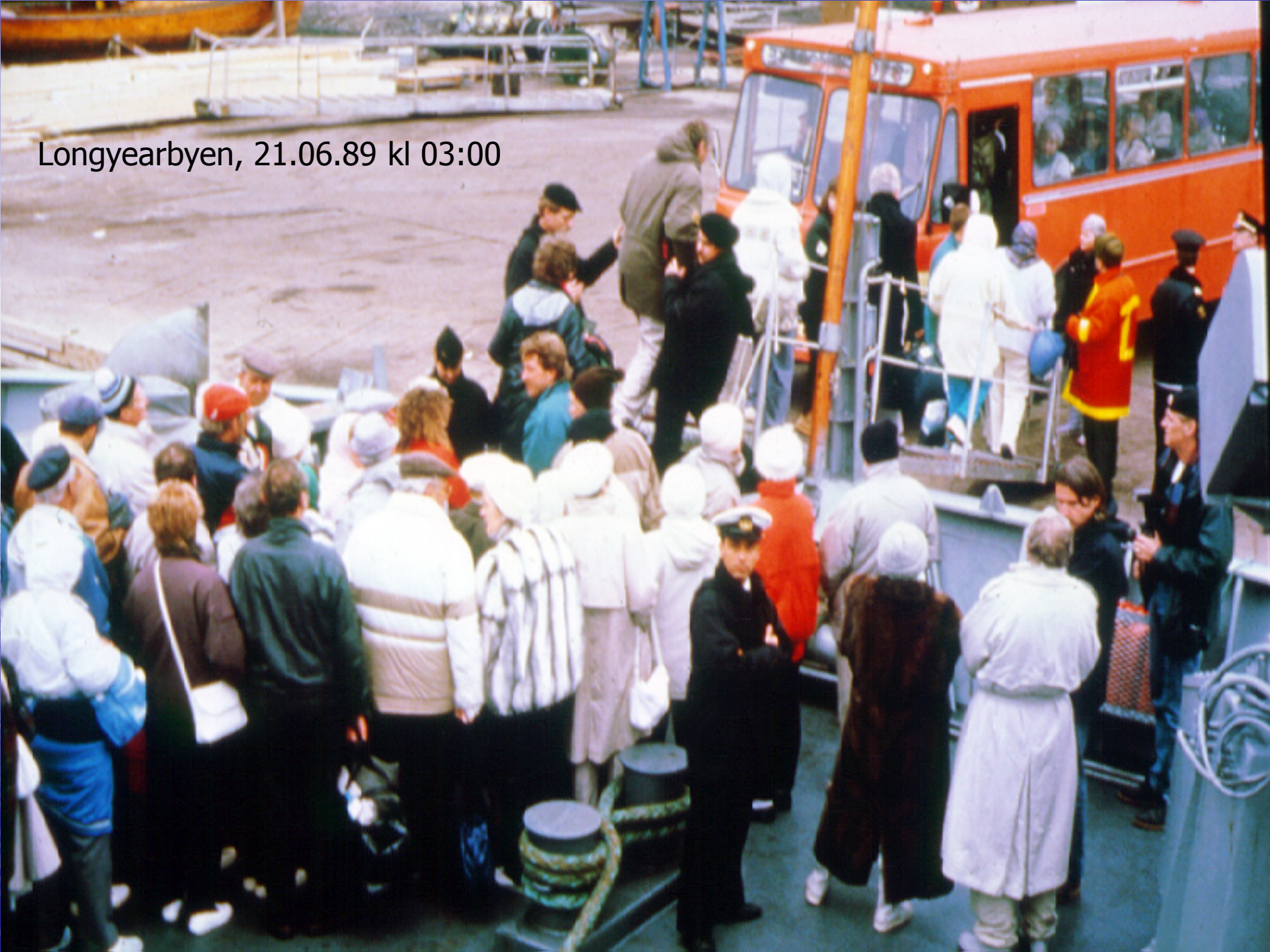
Longyearbyen, 21.06.89 kl 03:00