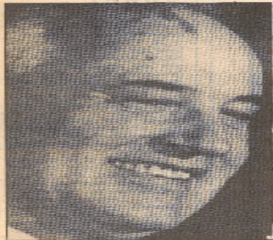
Partisjef Mikael Gorbatsjov viser dyp takknemlighet over innsatsen til de norske heltene. Han takker for bredden gjennom sin pressetalsmann.